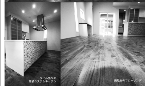
タイル張りの高級システムキッチン