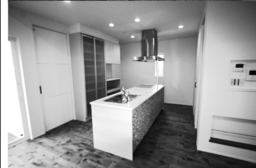
無垢材のフローリング