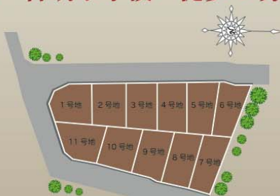
【区画図】 成約済の場合はご了承下さい。

月々 85,081 円 頭金 0円/ボーナス 0円 借入金額 2,977万円 ■返済期間 35年 ■金利 1.075% (京都市中央信用金庫) ※借入には審査があります。金利は平成25年7月現在の金利です。